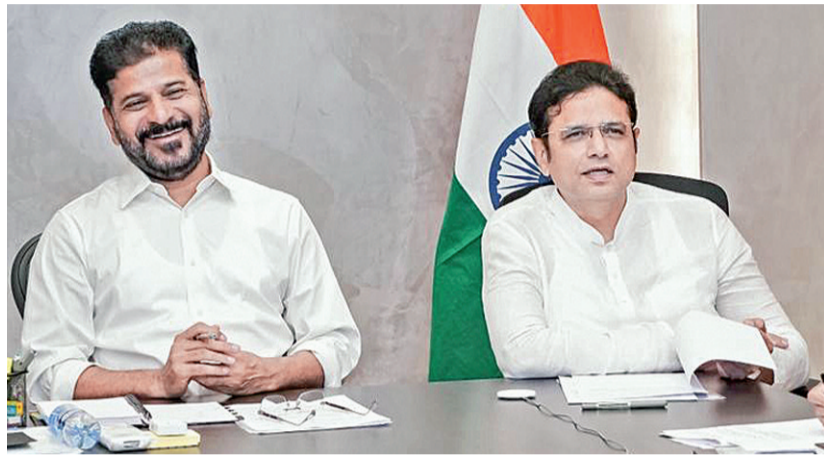
టీపైబర్ ప్రాజెక్టు అమలుపై బుధవారం కేంద్ర మంత్రి జ్యోతిరాదిత్య సింధియాతో విడియో కాన్ఫరెన్స్లో మాట్లాడుతున్న సీఎం రేవంత్, చిత్రంలో మంత్రి డి. శ్రీధర్ బాబు

ప్రభాతవార్త ప్రధాన ప్రతినిధి, హైదరాబాద్, మే 27: అమెండేడ్ భారత్ నెట్ ప్రోగ్రామ్ (ఏబీపీ) కింద తెలంగాణలో టీపైబర్ ప్రాజెక్టు అమలుపై కేంద్ర మంత్రి జ్యోతిరాదిత్య సింధియాతో ముఖ్యమంత్రి పి. రేవంత్ రెడ్డి, పరిశ్రమలు, ఇటీవల మంత్రి డి. శ్రీధర్ బాబుతో కలిసి పీడియో కాన్ఫరెన్స్లో పాల్గొన్నారు. అమెండేడ్ భారత్ నెట్ ప్రోగ్రాం సజావుగా అమలు చేసే దిశగా ముఖ్యమంత్రి కొన్ని కీలక అంశాలను సందియా దృష్టికి తీసుకువెళ్లారు. అమలుకు సంబంధించిన ఒప్పందాన్ని త్వరితగతిన కుదుర్చుకోవడం, పెండింగ్లో ఉన్న నిధుల విడుదలను వేగవంతం చేయడంపై చర్చించారు. మండలం నుండి గ్రామ పంచాయతీ రింగ్ నెట్ వరకు అమలుపై డిజిటి భారత్ నిధికి బదిలీ